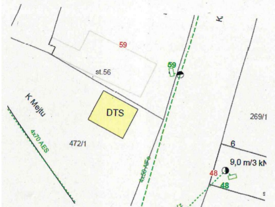
Obr. 1: Plánované umístění trafostanice.

Pozemek je v katastru nemovitostí veden jako ostatní plocha, ostatní komunikace. Vydání OV bude předloženo se žádostí k projednání příslušným orgánům obce.